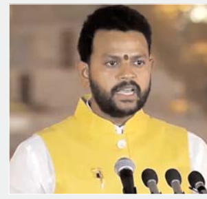
उड़ान योजना क्रियान्वित की, जिसका लाभ यह हुआ कि देश में 86 नये हवाई अड्डे, दो वाटरड्रम एवं 30 हेलीपोर्ट विकसित किये गये। 1601 नये मार्ग शुरू हुये जिन पर दो लाख 84 हजार अतिरिक्त उड़ानें हुईं और एक करोड़ 44 लाख यात्रियों ने हवाई यात्रा की। उन्होंने कहा कि इस

नई दिल्ली। सरकार ने देश के छोटे शहरों एवं कस्बों को हवाई सेवा से जोड़ने के लिये चल रही उड़ें देश का आम नागरिक (उड़ान) योजना को 2026 से अगले 10 साल और बढ़ाने की घोषणा की है। केन्द्रीय नागरिक उड्डयन मंत्री किंजरापु राममोहन नायडू ने सोमवार को उड़ान योजना के आठ वर्ष पूरे होने के मौके पर राजीव गांधी भवन में आयोजित एक कार्यक्रम में यह घोषणा की। नायडू ने कहा कि वर्ष 2016 में राष्ट्रीय नागरिक उड्डयन नीति में भारत के महानगरों के अलावा टियर2 और टियर3 श्रेणी के शहरों एवं कस्बों को हवाई सेवाओं से जोड़ने के लिये