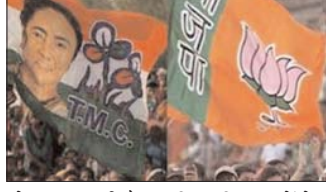
घोषणा कर दी है। आधिकारिक सूत्रों ने सोमवार को यह जानकारी दी। ममता

कोलकाता। पश्चिम बंगाल में सत्तारूढ़ तृणमूल कांग्रेस (टीएमसी) और उसकी मुख्य प्रतिद्वंद्वी भारतीय जनता पार्टी (भाजपा) ने 13 नवंबर को छह विधानसभा सीटों पर होने वाले उपचुनाव के लिए उम्मीदवारों की