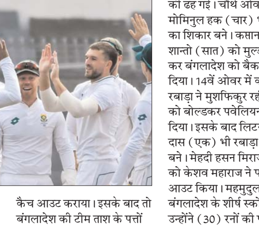
(शून्य) का विकेट गवां दिया। उन्हें मुल्डर ने मारकम के हाथों कैच आउट कराया। इसके बाद तो बंगलादेश की टीम ताश के पत्तों

एजेंसी मीरपुर। कगिसो रबाड़ा, वियान मुल्डर और केशव महाराज की घातक गेंदबाजी के दम पर दक्षिण अफ्रीका ने सोमवार को पहले टेस्ट मैच में बंगलादेश को पहली पारी में 106 के स्कोर पर समेट दिया। आज यहां बंगलादेश ने टॉस जीतकर पहले बल्लेबाजी करने का फैसला किया। बल्लेबाजी करने उतरी बंगलादेश की शुरुआत खराब रही और उसने दूसरे ही ओवर में सलामी बल्लेबाज शादमान इस्लाम