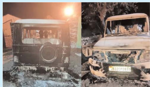
सहित एक अवसंरचना कंपनी के सात कर्मचारी मारे गए। हमले में पांच अन्य कर्मचारी घायल भी हुए। श्रमिकों पर यह हमला जम्मू-कश्मीर सरकार द्वारा सामान्य स्थिति दिखाने के लिए श्रीनगर में एक प्रमुख खेल आयोजन 'कश्मीर मैराथन' की मेजबानी के कुछ घंटों बाद हुआ। अधिकारियों

श्रीनगर। कश्मीर में नागरिकों पर लंबे समय बाद हुए सबसे घातक हमलों में से एक के लिए जिम्मेदार आतंकवादियों का पता लगाने के लिए सुरक्षा बलों ने सोमवार को बड़े पैमाने पर तलाशी अभियान जारी रखा। अधिकारियों ने यह जानकारी दी। रणनीतिक श्रीनगर-लेह राजमार्ग पर पर्यटक रिजॉर्ट सोनमर्ग के पास एक श्रमिक शिविर पर आतंकवादी हमले में रविवार शाम एक कश्मीरी डॉक्टर