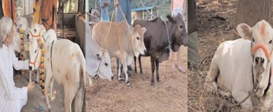
जिले के पुंगनूर शहर में पाई जाने वाली इस गाय का नाम इसके शहर पुंगनूर पर पड़ा है। इस गाय की औसत लंबाई दो से ढाई फीट तक होती है। इसके दूध में अन्य गायों की अपेक्षा बसा की मात्रा अधिक होती

मथुरा। विश्व में सबसे छोटे कद की पुंगनूर गाय अब मथुरा में वात्सल्य ग्राम की कामधेनु गौशाला में आ गई है। इस प्रकार की गाय अब तक मथुरा की किसी गौशाला या निजी व्यक्ति के पास नहीं थी। वात्सल्य ग्राम की अधिष्ठात्री साध्वी ऋतंभरा ने बताया कि पुंगनूर गाय विश्व की सबसे छोटी प्रजाति की गाय है। दक्षिण भारत के आंध्र प्रदेश के चित्तूर