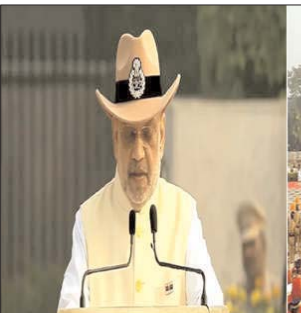
आज का दिन शहीद पुलिस कर्मियों की शहादत का सम्मान करने तथा उनके परिजनों को यह विश्वास दिलाने के लिए मनाया जाता है कि जिस उद्देश्य के लिए उनके परिवार के सदस्य ने बलिदान दिया है उसे हर

नई दिल्ली। केन्द्रीय गृह मंत्री अमित शाह ने सोमवार को पुलिस स्मृति दिवस पर यहां राष्ट्रीय पुलिस स्मारक जाकर शहीद पुलिस कर्मियों को श्रद्धांजलि अर्पित की। इस अवसर पर शाह ने पुलिस कर्मियों को संबोधित करते हुए उनके कर्तव्य परायणता की सराहना की और कहा कि बहादुर और वीर पुलिस कर्मों देश का गौरव हैं। उन्होंने कहा कि ये पुलिसकर्मों कश्मीर से कन्याकुमारी और कौबित् से कच्छ तक देश की रक्षा में जुटे हैं। उन्होंने कहा कि पुलिस स्मृति दिवस पर वह पुलिस कर्मियों के सर्वोच्च बलिदान को नमन करते हैं। उन्होंने कहा कि