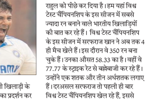
मोड़ते जा रहे हैं। फैंस भी उसी खिलाड़ी के साथ रहते हैं, जो अच्छे खेल का प्रदर्शन कर

एजेंसी नई दिल्ली। अभी अभी जिस खिलाड़ी ने अपना इंटरनेशनल डेब्यू किया है। कुछ ही महिने अपना पहला मैच खेला है, अब तो उसने भी केएल राहुल को पीछे कर दिया है। केएल राहुल इस वक्त टीम इंडिया के टॉप ट्रेड बल्लेबाज हैं। वैसे तो कहा जाता है कि खिलाड़ी को अपने खेल लिए ट्रेड करना चाहिए, लेकिन राहुल अपने खराब खेल के लिए ट्रेड कर रहे हैं। केएल राहुल के अच्छे खासे फैसले हैं, जो अब उनसे धीरे धीरे मुह